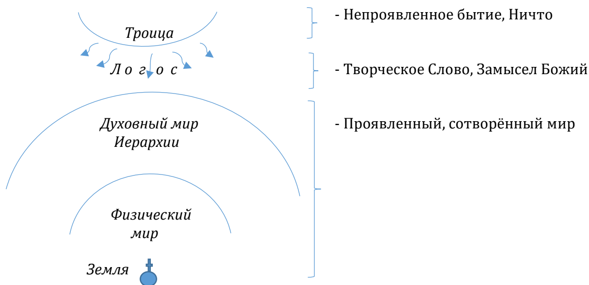
Илл. 2. Христианская картина мира

В какой-то момент — это Сознание , которое мы обозначили как Совокупность Семи Элогимов, поднялось, как мы говорили, в эту область, расположенную выше сотворённого мира, и там было пронизано Божественным Логосом . Теперь стало возможным достижение конечной цели Земли, поскольку с этого момента человек стал существом , созданным по « Образу и подобию Божию », и несёт в себе всю полноту Бытия. С одной стороны – он связан со всем сотворённым духовно-физическим миром, с другой, через живущий в нём Логос – с Троицей.